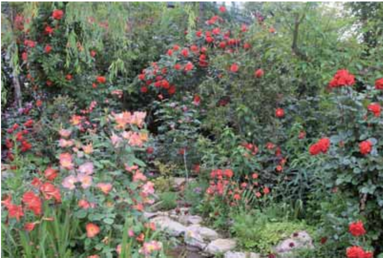
モノトーンの配色が穏やかな印象を生むレッドガーデン。 (横浜イングリッシュガーデン)

モノトーンの配色とは単色の濃淡の配色で、同系色とも言います。赤なら暗赤色からピンク、白までの花色を用います。変化が少ない分穏やかで、誰もが実践しやすい配色方法です。一般的にはホワイトガ