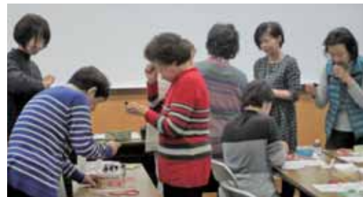
香りや成分を確かめる