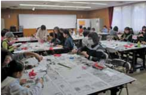
皆さん、とても熱中して製作