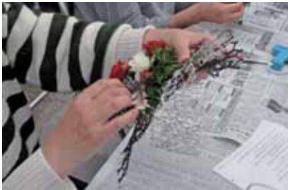
← もうすぐ出来上がり