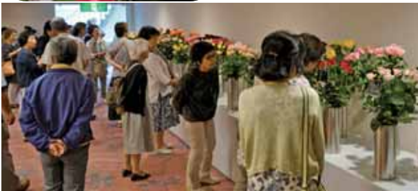
兵庫県産バラの美しさと芳香を楽しむ