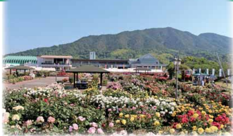
開放感あふれる園内