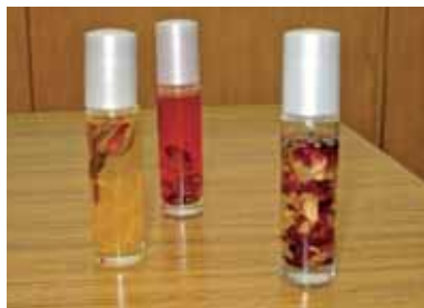
美しく出来上がった作品