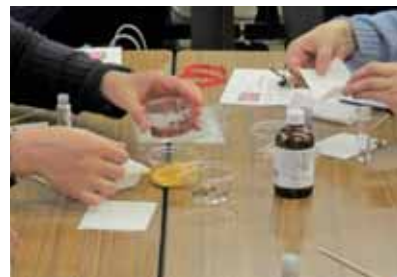
好みの材料をブレンド