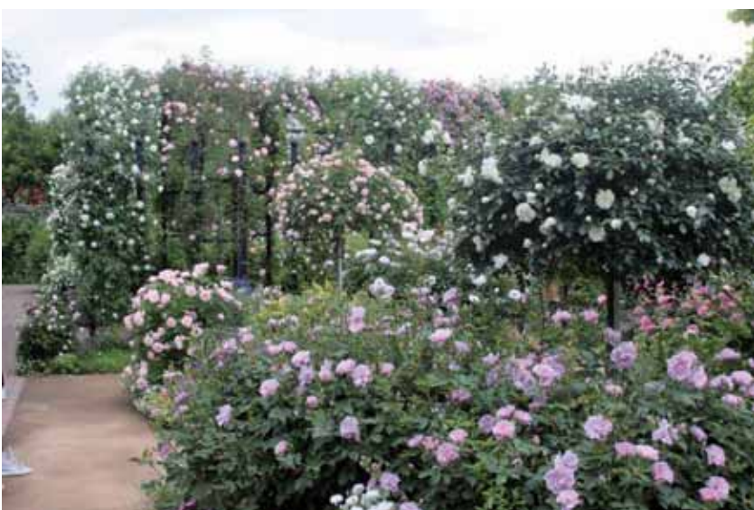
ピンク、薄紫、白のパステルカラーの庭。優しく柔らかな印象を与える。(横浜イングリッシュガーデン)

パステルはクレヨンの中の1種です。指で薄く伸ばすと淡く柔らかな感じになることから、パステルカラーの配色は明るく優しい印象を与えます。また、陰や狭い場所を明るく広く見せる効果もあります。バラの品種にはパステルカラーの色彩を持つものも多く用いやすい配色で、中でも淡いピンクのバラの優美さには誰もが心引かれます。ただパステルカラーは白を多く含む膨張色なので、ぼんやりとぼやけて見えるときには、アクセントになる濃い花色や葉色を組み合わせるとよいでしょう。