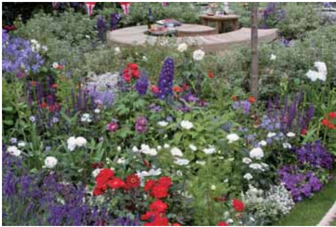
赤・青・白による色相、明度、彩度のコントラストの調和が素晴らしい。(イギリス ハンプトンコートフラワーショウ)