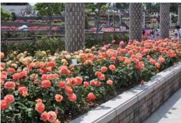
オレンジ、赤、黄の類似色のボーダーガーデンは華やかな中にもまとまりがある。(荒牧バラ公園)

近代のガーデンを語る場合、植物の色、形、材質によるハーモニーが美しい庭を作るということを忘れてはなりません。中でも配色(カラーコーディネート)は非常に大切な要素です。バラ花壇においても好みのバラを漫然と植えたのでは、まとまりのない花壇になってしまいます。ただ、バラはそれだけで優美で華やかであるため、他の植物との組み合わせを積極的には求められて来ませんでしたが、他の植物を含めた配色を考えることで、さらなるバラの魅力が引き出されるはずです。まず基本的な配色の方法を知ることから始めましょう。