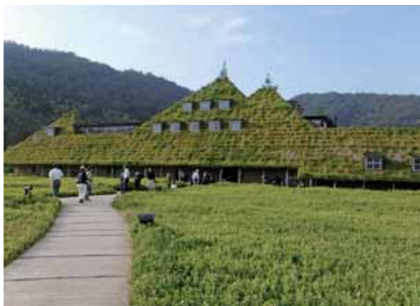
刈り取り後の田園やササが広がる中に立つラコリーナ近江八幡メインショップ

和菓子の「たねや」、洋菓子の「OLBIKARO」を展開するたねやグループが運営するこの施設は、周囲の水郷や緑を生かした美しい里山風景の中に溶け込んでいました。開放感にあふれ、思い切り深呼吸できました。お買い物も楽しんでいただきました。