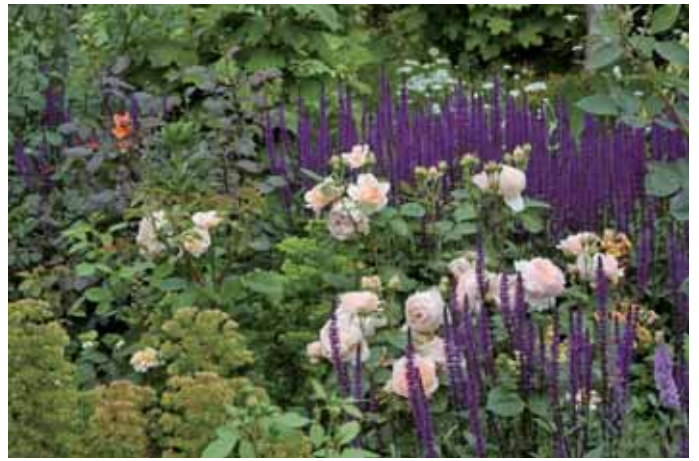
紫のサルビアスペルバと淡いピンクのバラは色彩のコントラストだけでなく明るさと花形のコントラストも合わせ持つ。(横浜イングリッシュガーデン)