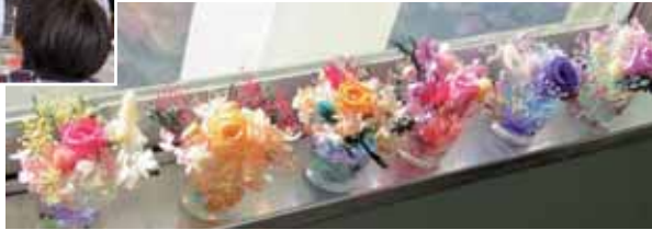
全員の作品を並べて撮影