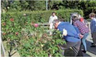
香り確かめる参加者

次に、新しくリニューアルされたレストハウス2階でジェルキャンドルを作りました。バラのプリザーブドフラワーとアロマストーンと一緒にアレンジ。色や香り、飾りを施し、ゼリーのような質感とあいまって、見ているだけで気持ちが華やくポップな作品がズラリ出来上がりました。