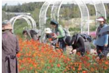
ハーベストの丘のキバナコスモス