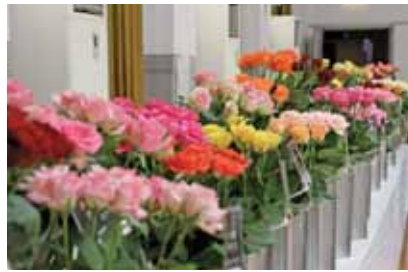
兵庫県産切りバラの展示