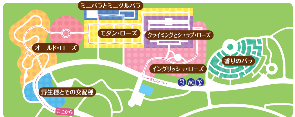
バラ園エリアマップ

春と秋のシーズンには「ローズフェスティバル」を開催しますので、皆さんぜひお越しください。