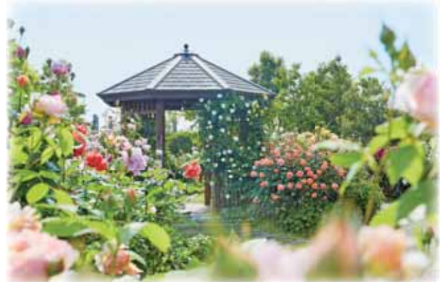
イングリッシュローズエリア

バラは、約1,540品種、約2,630株を所有し、関東有数の品種数を誇っています。フラワーゾーンにあるバラ園“薔薇の轍(わだち)”は、バラと育種家が辿った今日までの道のりを、車の通った両輪の跡＝轍に例えて名づけました。バラの品種改良の歴史に沿って系統・分類ごとに観賞できる“歴史園”になっています。