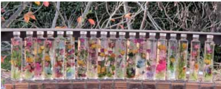
全員の作品を並べて撮影

しつかり2時間細かい作業が続きましたが、周りの方と相談しながら、集中して製作されていきました。真紅のバラが際立つ作品が出来上がりました。