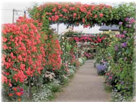
④ まるで梨園へ導くようなバラのアーチと宿根草

い」と話してくれました。さらに2017年には、新たにダリア園まで作り、梨が実をつける頃にはバラの花々にダリアが加わり圧巻の農景観を堪能できます。