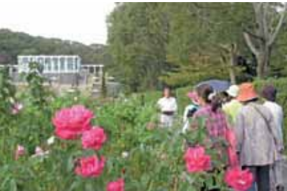
須磨離宮公園でバラ園見学

最後に、緑豊かな戸外に出て、全員の作品を並べて撮影しました。多様な作品が出来上がり、互いに鑑賞しあい、和やかなひとときになりました。