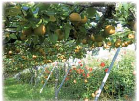
⑤ 梨園の向こうに広がるダリア園