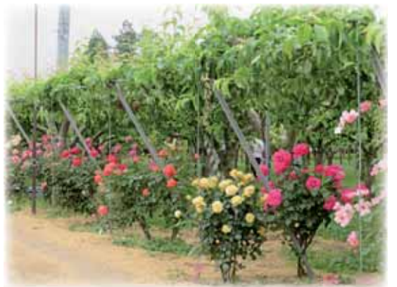
③ 梨園を囲むように植栽されたバラ

い」と話してくれました。さらに2017年には、新たにダリア園まで作り、梨が実をつける頃にはバラの花々にダリアが加わり圧巻の農景観を堪能できます。