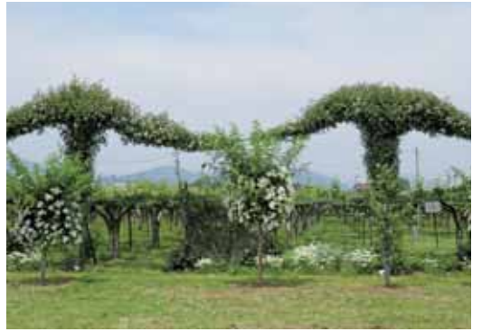
⑦ 震災復興を願って設えた双葉バラ園シンボルのガーランド