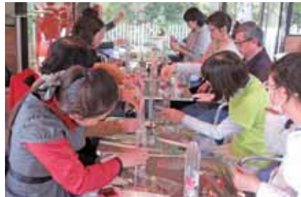
ハーバリウム製作風景