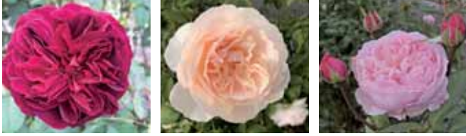
‘ムンステッド・ウッド’