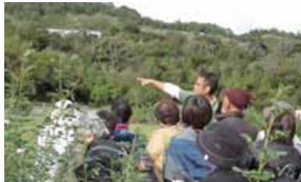
デビッド・オースチン イングリッシュローズガーデンでの園内ガイド