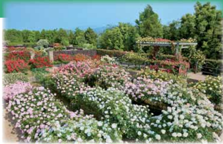
クライミングとシュラブローズエリア