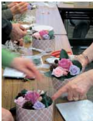
清楚で上品な作品がもうすぐ出来上がり