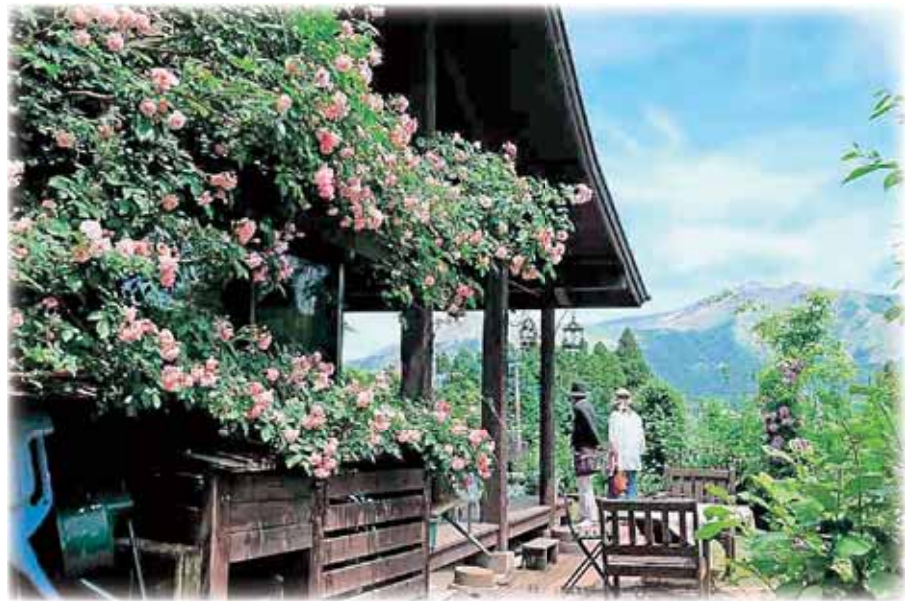
①阿蘇の山を借景に咲くバラ

10年余り前、元からそこにあつたかのような林と自生種の植物を生かしたガーデンづくりが始まりました。