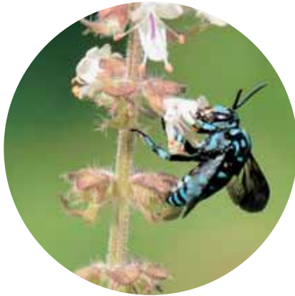
④ルリモンハナバチ

ラルガーデン」に仕上がっています。暖かい地方にしか生息しないとされる「幸せを呼ぶ青い蜂」と言われている「ルリモンハナバチ」も蜜を求めてやって来ます。また、ガーデンを楽しんでもらうよう、手づくりのピザ窯や燻製窯、小鳥のための水飲み場や巣箱、木陰に置かれたベンチなどがそこかしこにあります。