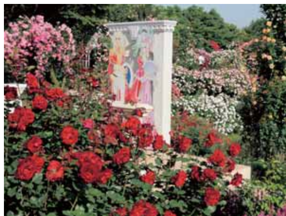
ベルばらのテラス