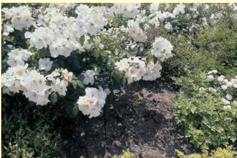
戻咲きの‘サリー・ホルムズ’