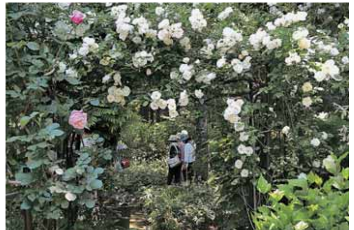
②ツルバラのゲートの奥に広がるガーデン