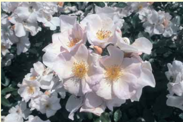
咲き始めの‘サリー・ホルムズ’

‘サリー・ホルムズ’は、日本ではあまり売られていませんが、特にイングリッシュ・ガーデン用としては良いバラです。他の植物と混植すると非常に美しい環境を作るので、病気に強いだけに管理もしやすく、今後はこうした品種で日本の気候に適応した品種を選抜して取り込みたいものです。