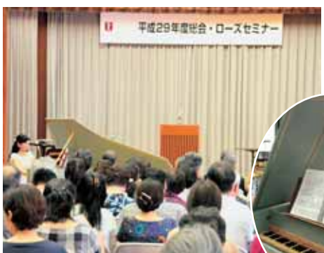
チェンパロのミニコンサート