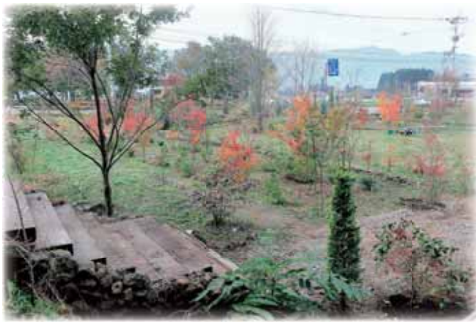
⑤3年後の完成をめざし作庭中のガーデン