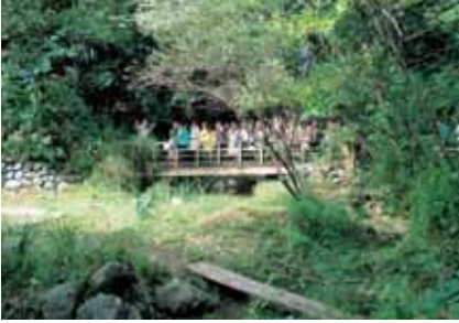
梅小路公園 「いのちの森」