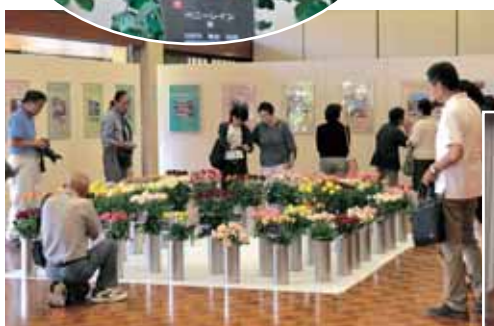
兵庫県産バラの展示